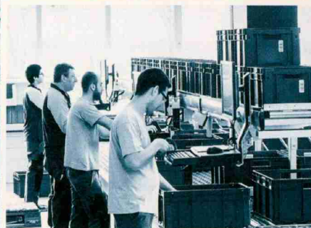
2 ZFV-UNTERNEHMUNGEN Die Genossenschaft bietet gratis Mitarbeiterweiterbildungen. 3 MÖBEL PFISTER Der Einrichtungsspezialist hört auf Verbesserungsvorschläge seiner Leute.

1 ISS SCHWEIZ Der Gebäudedienstleister legt Wert auf die Wertschätzung der eigenen Leute, etwa durch interne Auszeichnungen. Das ist im Dienstleistungssektor besonders wichtig, denn dort gibt es kein fertiges Produkt, auf das die Mitarbeiter stolz sein können.